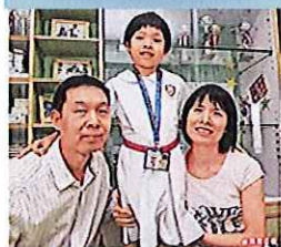
換心女童重踏校門