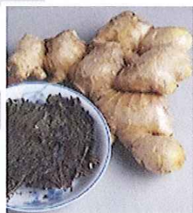
zoom 紫蘇（左）、 生姜（右）